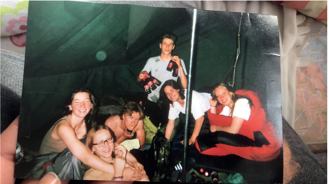
Throwback naar jins anno 2017