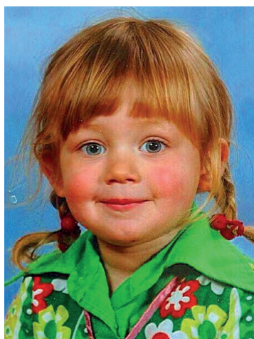
Fleurige Slingeraap +32 471 73 74 22