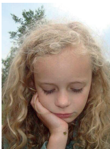
Onberispelijke Valk +32 475 50 17 92