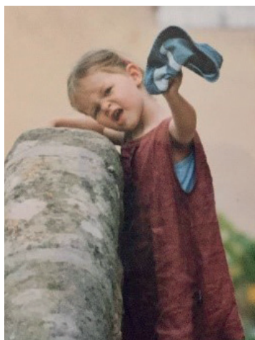
Amicale Sarus +32 468 33 31 44

Wat vind jij van onze kinderfoto's? Laat het ons weten op je eerste vergadering!