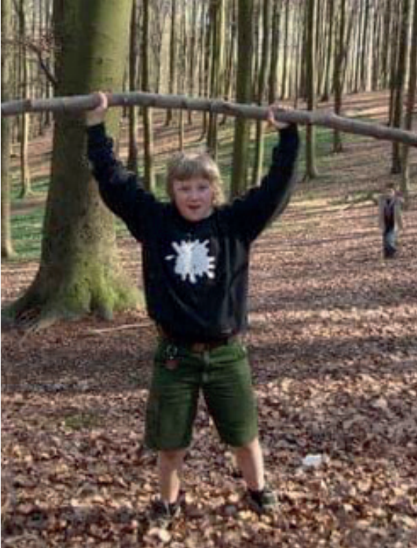
TROTSE COATI - EHBO