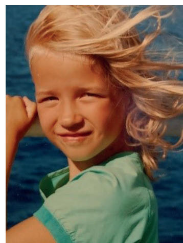
Blijmoedige Kluut +32 471 074 087